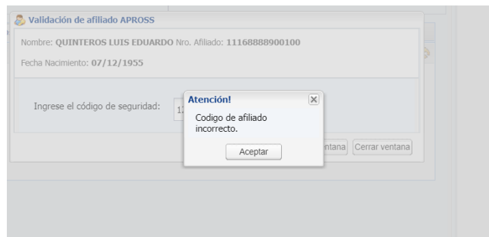
imagen 2: Rechazo de código de seguridad